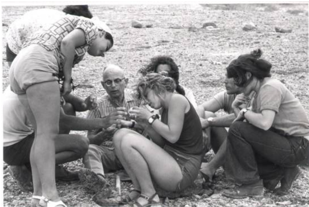
1968: פרופ' מנדלסון מדריך סטודנטיות בקורס פאונסיטיקה במדבר יהודה